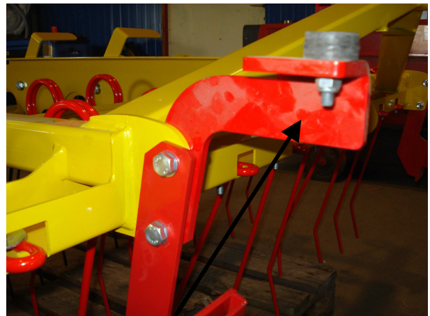
Posizione di lavoro