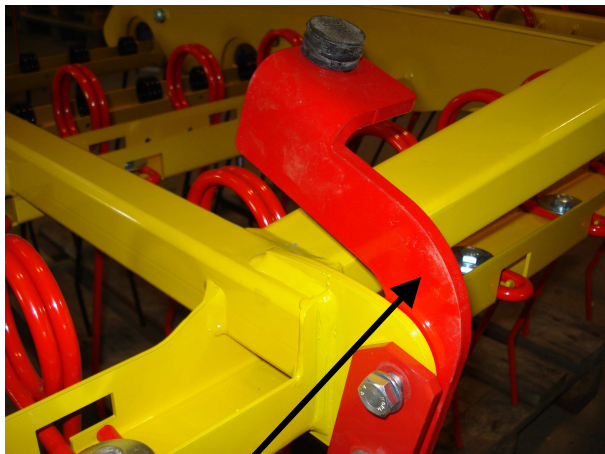
Posizione alla consegna